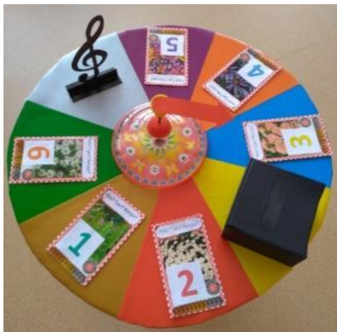
Интеллектуальная игра «Что? Где? Когда?»

Интеллектуальные игры способствуют развитию мыслительных способностей ребенка, умению анализировать, выделять главное, сравнивать, выбирать из различных вариантов, а также умению отстаивать свою позицию.