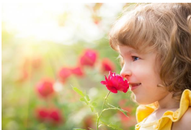
Не все цветы безопасны

Они могут выглядеть красиво и привлекательно, но быть очень опасными для малыша.